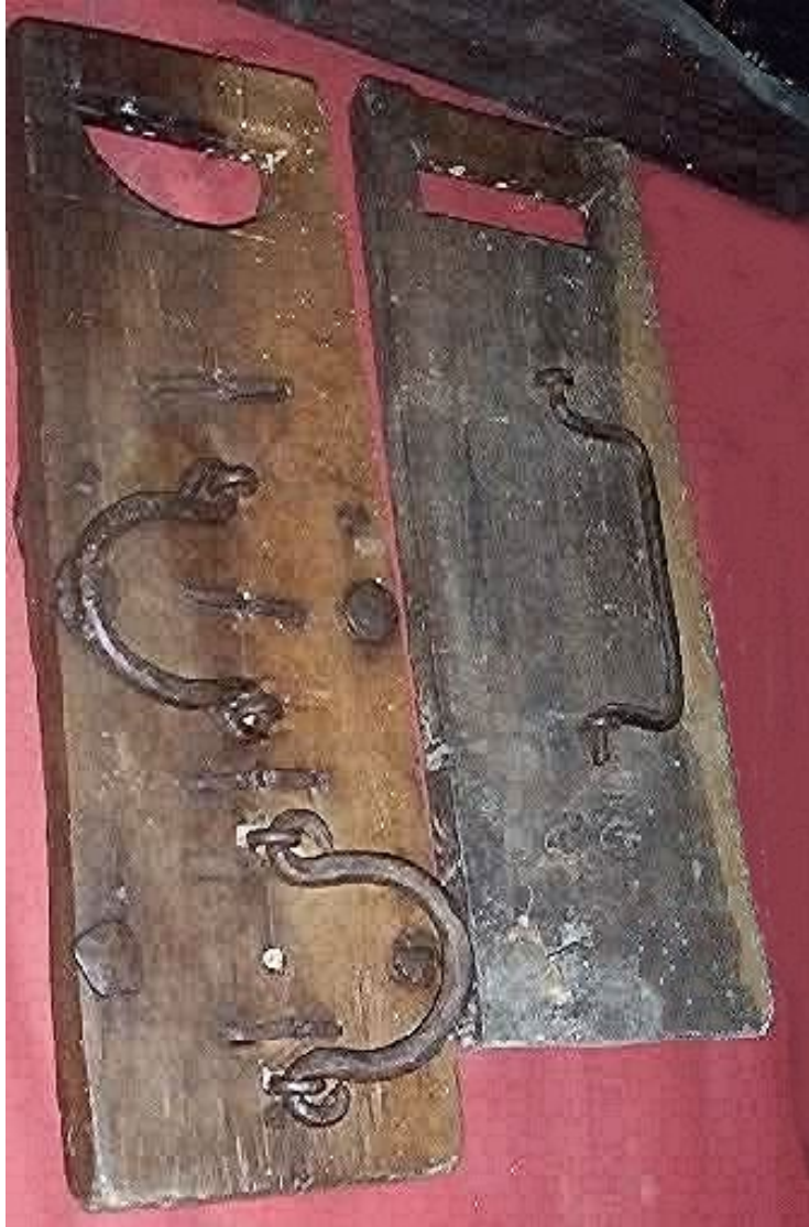
Due tipi di “dróccela” che sostituiva le campane dal giovedì Santo fino allo scioglimento delle campane al canto del Gloria il sabato Santo. Durante questo periodo era questo strumento che chiamava i fedeli alle cerimonie in quel periodo di silenzio.