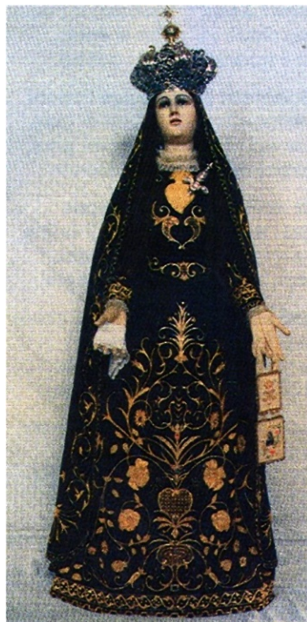
e la Madonna con il coltello nel cuore.