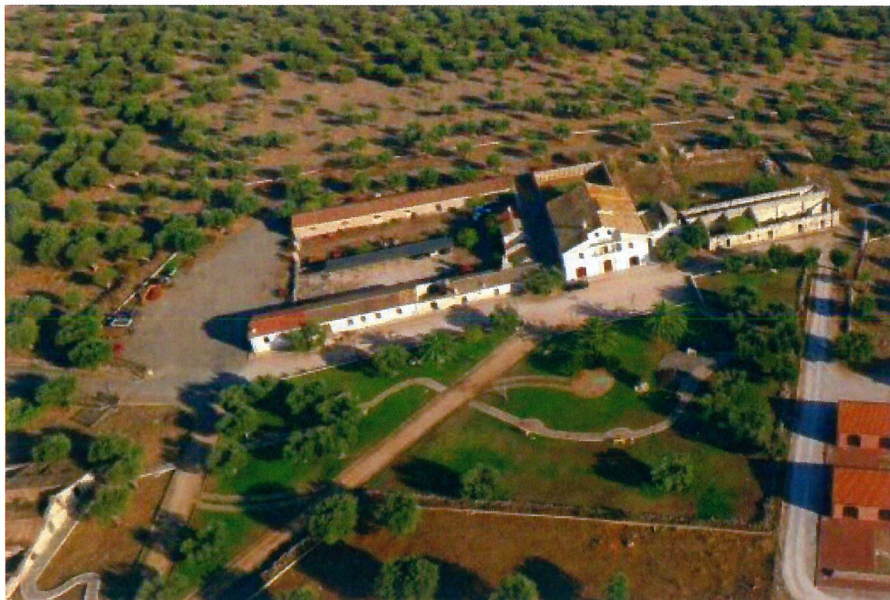
Veduta dall'alto della sede istituzionale ASP

Venerdì 8 maggio 2020 ha avuto inizio la pubblicazione dell'avviso esplorativo per acquisire manifestazioni di interesse alla progettazione, finanziamento, realizzazione, gestione e manutenzione di tettoie o gazebo o pensiline o pergole dotate sulle coperture di pannelli per la produzione di energia elettrica da fonte solare (fotovoltaico), mediante lo strumento della finanza di progetto, nell'ampia superficie circostante la sede istituzionale in località San Nazario, agro di San Nicandro Garganico (Fg).