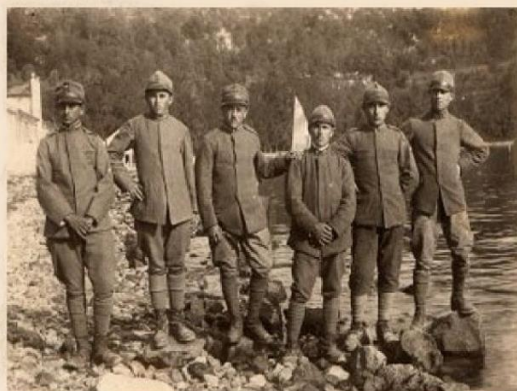
Immagine storica con i nostri baldi fanti che si sono fatti immortalare sulle sponde del sacro fiume Piave, quel fiume che con le sue placide acque mormorò al loro passaggio nella notte di un 24 maggio durante la guerra mondiale del 1915/18 quando quelle acque diventarono rosse col sangue dei nostri valorosi soldati.

Fotografato fra i commilitoni il sannicandrese