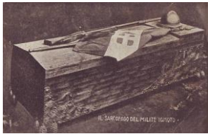
Sarcofago originale del Milite Ignoto

“Quèstu, sapisse, me fa, jè u munumènde a i suldate cadute nd'a la prima wèrra mundiale du quinnece/decedòtte e dinde ce sta sulamènde nu taute che nu crestejane scansciute, ca nne jè nu scenziante, nu gèneje, nu pèzze rösse o nu dótte